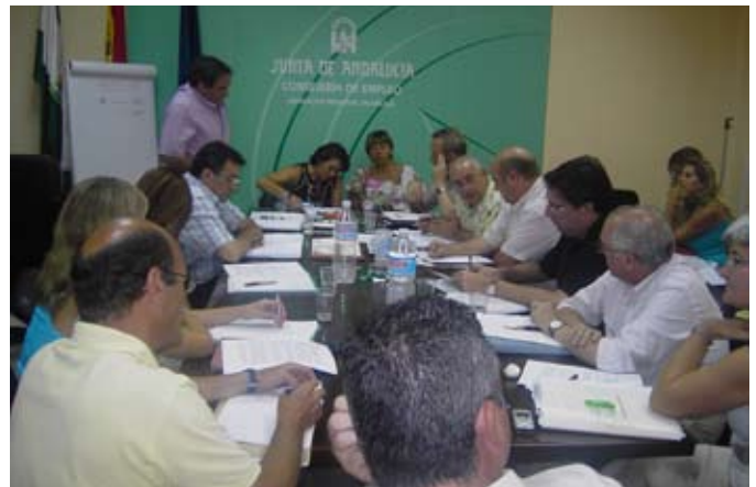
Reunión en el SERCLA